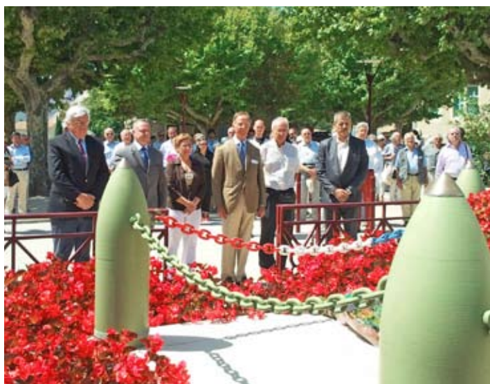
Dépôt de gerbes au Monument aux Morts de Cruas.